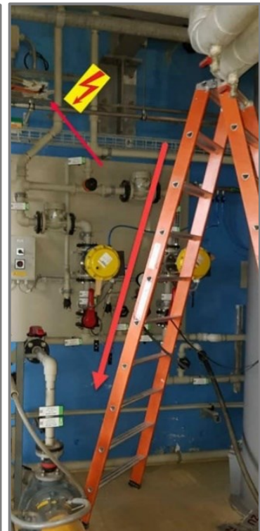
Lieu de l'accident