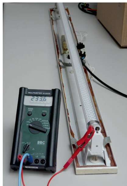
Choc électrique possible lors de l'installation/encliquetage d'un côté d'un tube LED.