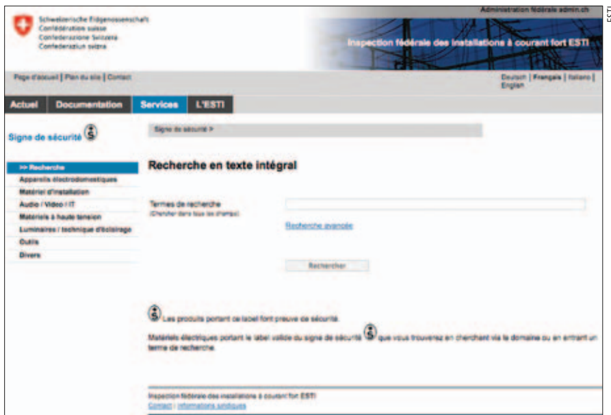
Figure 1 Recherche de matériels.