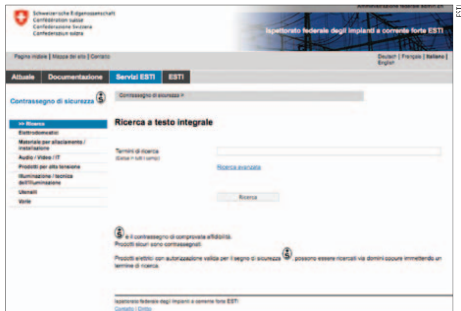
Figura 1 Ricerca di prodotti.